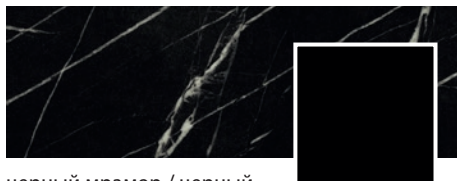
черный мрамор / черный